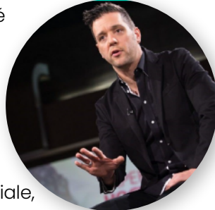
Personnalité médiatique canadienne George Stroumboulopoulos

La conférence d'ouverture a été donnée par une personnalité médiatique canadienne, George Stroumboulopoulos, qui a fait part de ses expériences fascinantes de rencontres et d'entrevues avec des premiers ministres, des célébrités de renommée mondiale, des astronautes, des généraux de l'armée et de nombreuses autres personnalités, ainsi que de la manière dont il a utilisé le pouvoir de la curiosité.