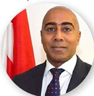
Sous-ministre des Transports du Canada Arun Thangaraj Président honoraire de la Semaine de PP 2023

L'ordre du jour du congrès comprenait une incroyable variété de présentations, de tables rondes et de séances simultanées totalisant un maximum de 42 heures vérifiables de DPC. En plus de ce programme exceptionnel, le tant attendu programme des cadres supérieurs ainsi que le programme très prisé de mentorat éclair pour les DPF/DPV sont également passés à la formule « en présentiel », au plus grand plaisir des personnes participantes.